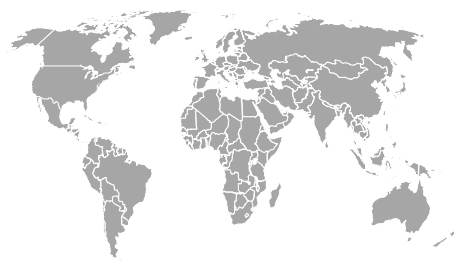
MINI «BUILT-IN CONNECTIVITY»